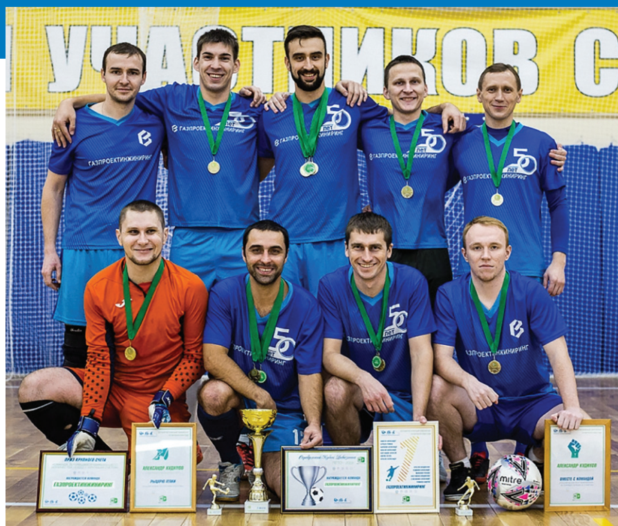
Футбольная команда АО «Газпроектинжиниринг»

Мы поздравляем нашу команду и желаем им новых побед!