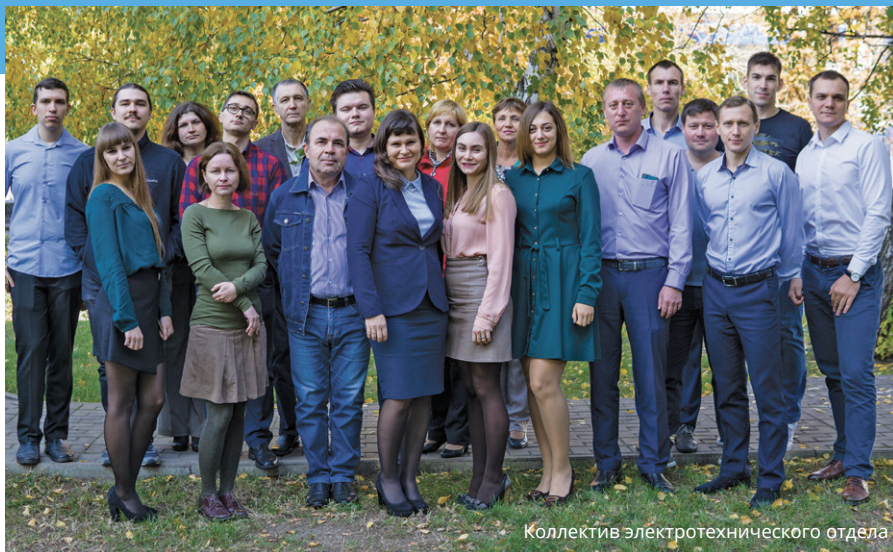
Коллектив электротехнического отдела

История электротехнического отдела началась в 70-80-е годы XX века. В его современном виде подразделение образовалось в мае 2017 года и имеет численность 25 человек. Они выполняют весь комплекс работ по проектированию электрооборудования и электрохимической защиты объектов транспортировки, добычи и переработки газа, а также промышленных предприятий и объектов соцкультбыта. Особенностью работы в отделе является то, что придя в него молодыми специалистами, в подавляющем большинстве люди остаются здесь работать на всю жизнь. В традициях отдела давно обосновались преемственность поколений, наставничество, передача проектного и жизненного опыта. За последнее время качественно изменился процесс проектирования. Следуя современным тенденциям развития строительной отрасли, проектные работы в отделе ведутся преимущественно с использованием 3D-проектирования с применением программных средств REVIT, AVEVA. Происходит процесс внедрения и адаптации в работу программного средства NanoCAD Electro. Совершенно на новом уровне и в кратчайшие сроки разработаны проекты по объектам: «Реконструкция ДКС-1,2 на Оренбургском НГКМ»; «Логистический центр ПАО «Газпром»; капитального ремонта ГРС ООО «Газпром трансгаз Москва»; «Газопровод-отвод к г. Устюжна Вологодской области»; «Газопровод высокого давления от ГРС № 2 г. Елабуга (Центральная) до ПАО «НКНХ»; «Складской ком-