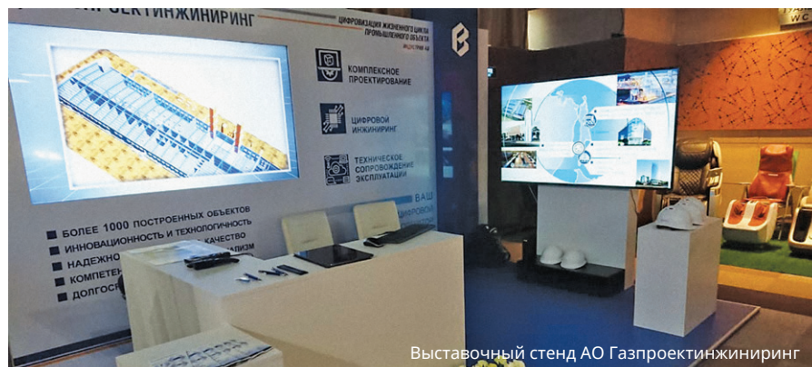
Выставочный стенд АО Газпроектинжиниринг

зарубежных и отечественных компаний, осуществляющих деятельность в нефтегазовом секторе на о. Сахалин. Особо была отмечена роль института в программе увели-