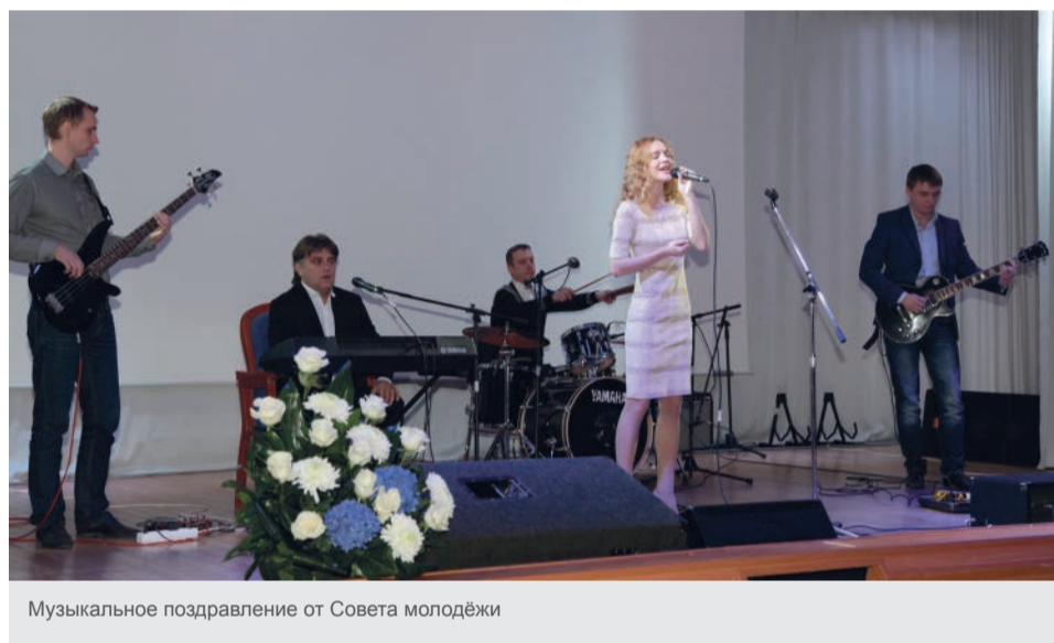
Музыкальное поздравление от Совета молодежи

Торжественное мероприятие завершилось праздничным обедом в банкетном зале Общества.