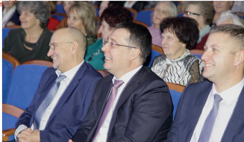
Теплая обстановка в зале во время поздравления ветеранов не оставила никого равнодушным